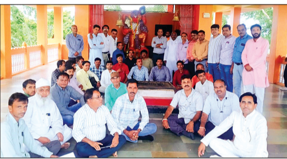
हरिभूमि न्यूज़ ▶▶ राजगढ़

जिले के स्कूलों में शैक्षणिक व्यवस्था में सुधार एवं शिक्षकों की समय पर उपस्थिति सुनिश्चित करने के उद्देश्य से विभाग ने हमारे शिक्षक एप के जरिए ई-अटेंडेंस की शुरूआत की है। गत दिवस कलेक्टर डॉ. गिरीश मिश्रा ने शिक्षा विभाग के अधिकारियों को इस संबंध में तलख निर्देश दिए हैं कि ई-अटेंडेंस न लगाने वाले शिक्षकों को नोटिस देने सहित वेतन रोकने की कार्यवाही की जाए। इसी संबंध में शिक्षा जगत के 10 विभिन्न संगठनों के संयुक्त मोर्चा पदाधिकारियों की एक आवश्यक