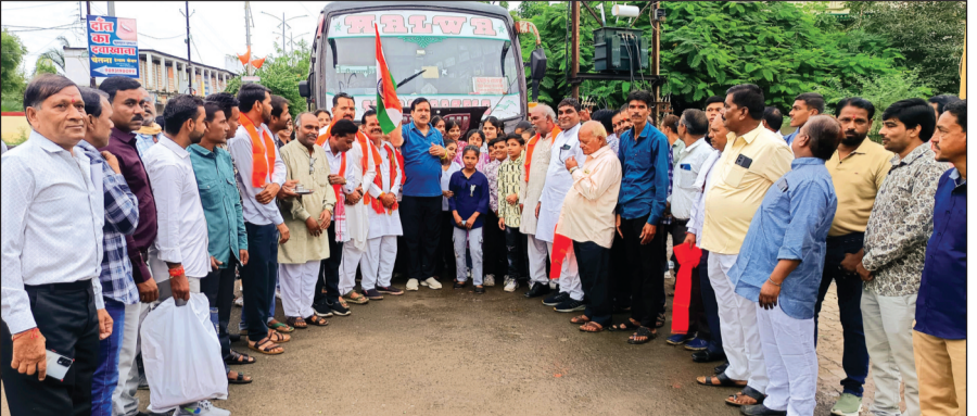
हरिभूमि न्यूज़ ▶▶ सारंगपुर