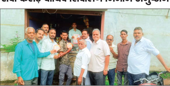
हरिभूमि न्यूज़ ▶▶ नरसिंहगढ़

आगामी सवा करोड़ पार्थिव शिवलिंग निर्माण धार्मिक आयोजन को लेकर हिन्दू उत्सव समिति ने जनसंपर्क अभियान शुरू कर दिया है। कार्यकर्ता घर-घर पहुंचकर पत्रक एवं पीले चावल देकर श्रद्धालुओं को आयोजन में शामिल होने का आमंत्रण दे रहे हैं। स्टैंडियम ग्राउंड पर विशाल पंडाल सजाया