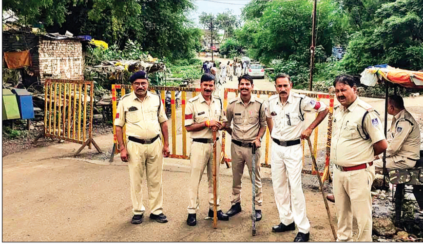
हरिभूमि न्यूज़ ▶▶ खिलवीपुर

नगर में रविवार को इमली स्टैंड स्थित नाले की विवादित भूमि को लेकर रविवार को प्रशासन ने बड़ा कदम उठाया। कलेक्टर के निर्देश पर राजस्व विभाग